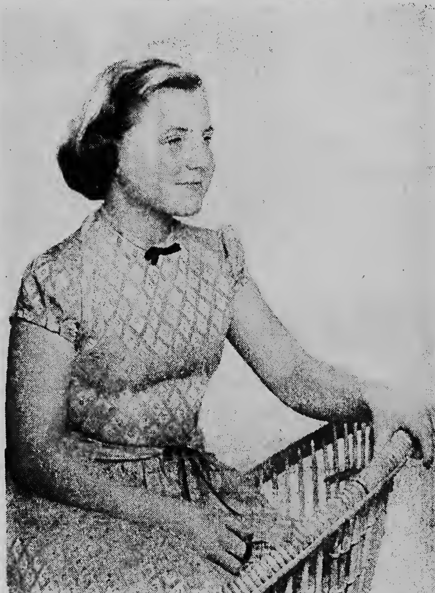
Awe S.A.R. Prinses Margriet ta cumpli 16 anja y cu e ocasion aki nos Casa Real ta di fiesta. Mescos cu semper, sea den alegria of den temponan mas oscuro, tur e diferente pueblonan cu ta compone e Reinado Neerlandes, ta comparti tambe aden. Pesei awe na Antillas Neerlandes nos tur ta celebra e aniversario di Prinses Margriet den nos pensamentonan. Na e Princesa y su Mayornan ta bai pe medio aki nos sinceras felicitaciones.